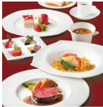
料理写真はイメージです。